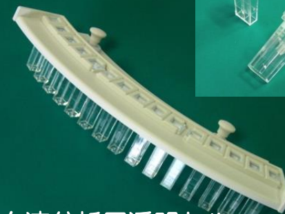
血液分析用透明セル