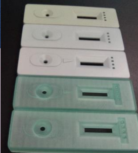
感染症検査キット